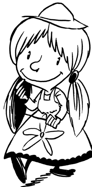
Illustration : Jean Morin