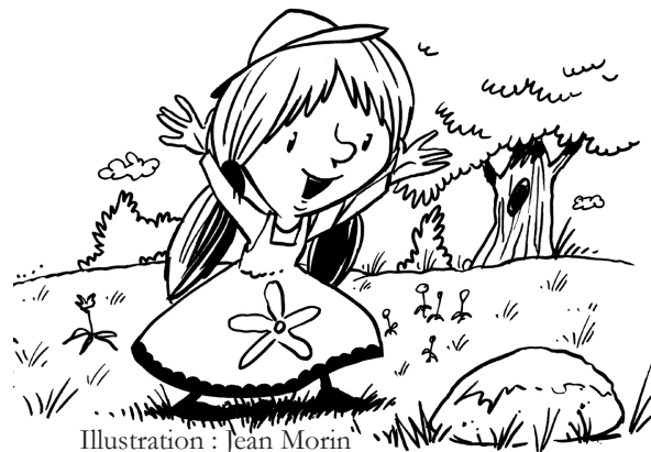
Illustration : Jean Morin

Éditions Michel Quintin 4770, rue Foster C.P. 340 Waterloo (Québec) Canada J0E 2N0