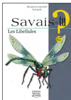
67- Les Libellules 978-2-89762-225-1

Plus de 600 000 exemplaires de la collection Savais-tu? vendus au Québec