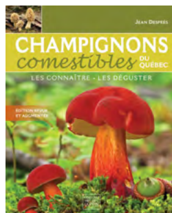
Champignons comestibles du Québec: Les connaître, les déguster 978-2-89762-095-0