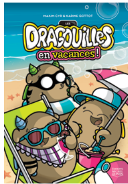
Les dragouilles en vacances! 978-2-89762-227-5