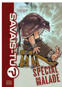
4- Spécial malade 978-2-89762-221-3