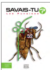
52- Les Punaises 978-2-89435-594-7