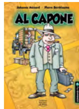
15- Al Capone 978-2-89435-798-9