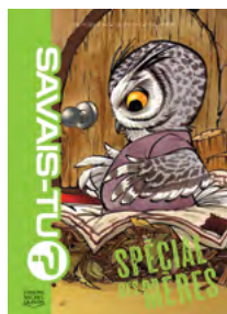
3- Spécial des mères 978-2-89762-220-6