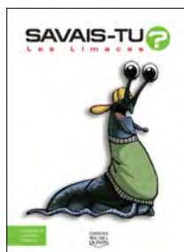
51- Les Limaces 978-2-89435-593-0