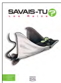
54- Les Raies 978-2-89435-598-5