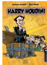
17- Harry Houdini 978-2-89762-067-7