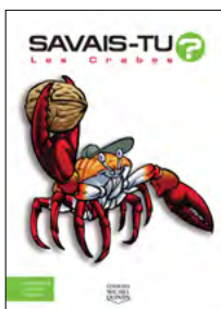
55- Les Crabes 978-2-89435-699-9